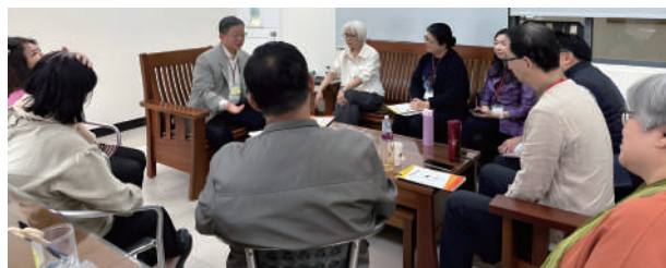
▲ 退修會博士班分組